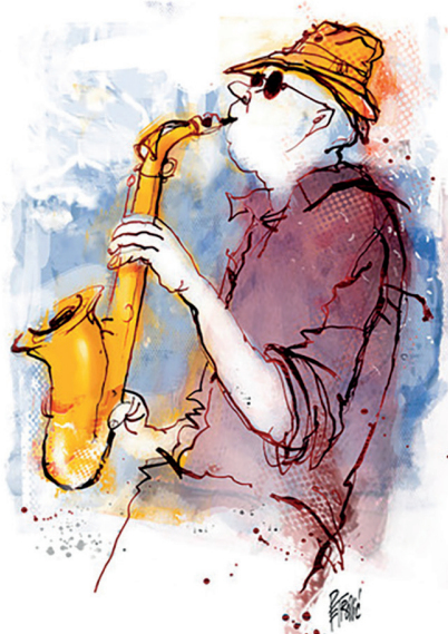
Zeichnung Zoran Petrovic.

Die Partnerschaft mit dem SANDKORN ermöglicht im Rahmen der „Special Edition . Hemingway Lounge goes ...“ eine Bühne für größere Ensembles.